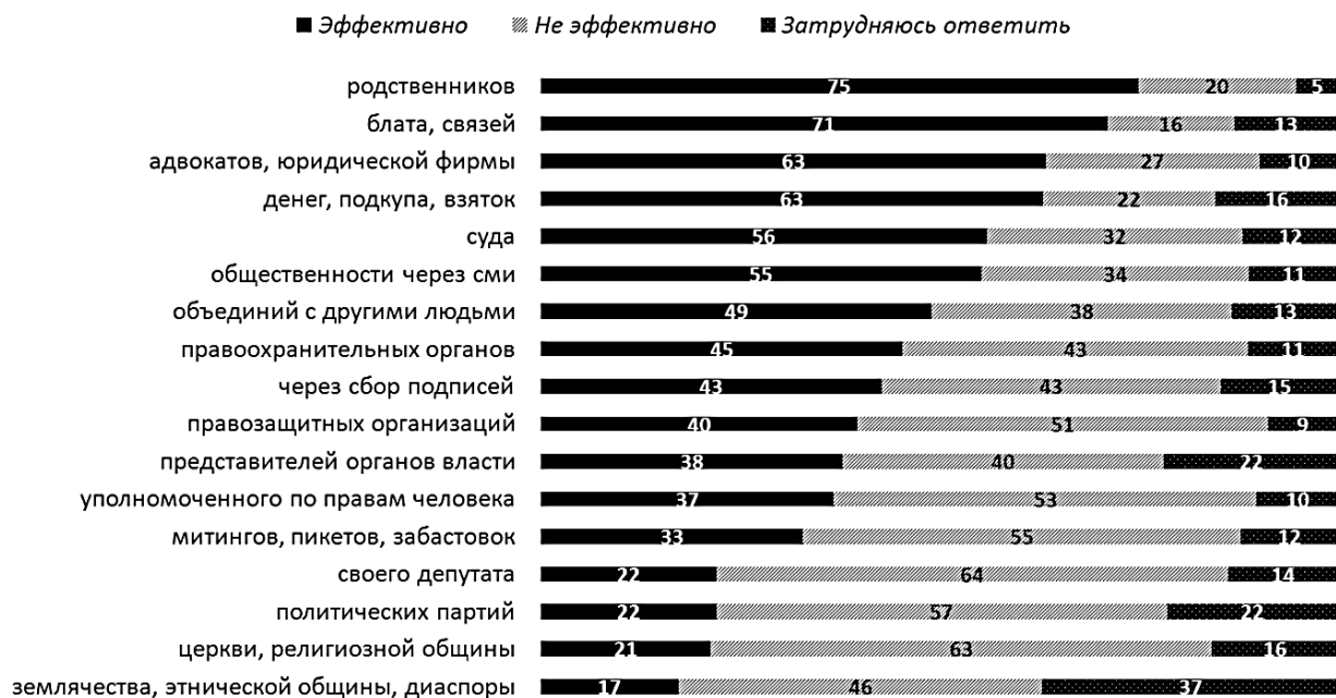
Насколько эффективно для решения проблемы, защиты своих прав обращаться за помощью... (в % в целом по выборке)

Изучите результаты опроса, представленные в виде диаграммы, и сформулируйте по одному выводу об уровне правовой и политической культуры граждан РФ, свои выводы аргументируйте данными таблицы.